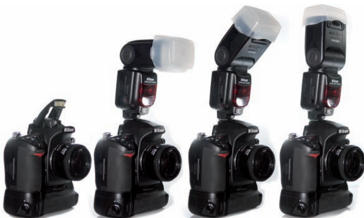
Rysunek 2.17. Różnica między wbudowaną a zewnętrzną lampą błyskową widoczna jest tutaj na przykładzie aparatu Nikon D700 z zamontowaną lampą SB-900. Zewnętrznej lampy można używać pod wieloma kątami. Model SB-900 ma także dyfuzor, który rozprasza światło lampy