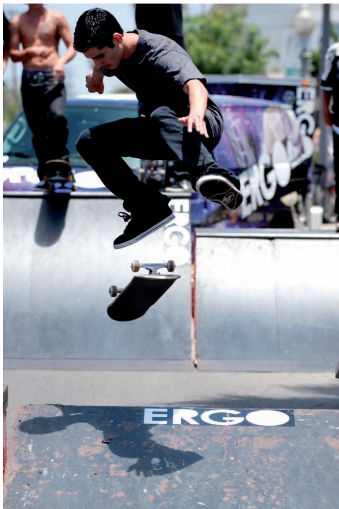
Rysunek 2.3. Ten deskorolkowiec został sfotografowany w południe, gdy słońce świeciło bezpośrednio nad nim. Ze względu na pozycję słońca cień pada bezpośrednio pod nim, a spodnie i buty znajdujące się w cieniu utraciły detale. Ustawienia: 1/1600 s, f/4, ISO 200

Takie oświetlenie pojawia się, kiedy jedyne źródło światła padającego na fotografowany obiekt znajduje się bezpośrednio nad nim (na przykład słońce w południe). Gdy jedyne źródło światła znajduje się bezpośrednio nad fotografowaną sceną, na przykład gdy fotografujesz krajobraz, obraz jest mało wyrazisty ze względu na brak cieni. Najszybszym sposobem sprawdzenia, czy światło znajduje się dokładnie nad obiektem, jest przyjrzenie się kierunkowi cienia: nie będzie go wcale.