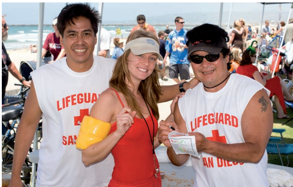
Rysunek 2.18. Uczestnicy festynu pozują do zdjęcia. Dodałem światło dopełniające, aby uzupełnić światłem cienie rzucone przez daszki. Zmniejszyłem moc lampy błyskowej o dwa pełne skoki, aby zrównoważyć dostępne oświetlenie. Ustawienia: 1/250 s, f/7,1, ISO 100

Zastanów się, co się dzieje, gdy fotografujesz na świeżym powietrzu osobę w kapeluszu. Zadaniem kapelusza jest osłonięcie oczu od słońca, ale przy okazji część twarzy pozostaje w cieniu rzucanym przez rondo kapelusza. Gdy robisz zdjęcie osoby w kapeluszu w bardzo jasnym słońcu, kontrast między cieniem kapelusza i jasnym niebem sprawia, że ciemne obszary zostają niedoświetlone lub jasne są prześwietlane, zależnie od tego, dla którego elementu ustawisz ekspozycję. Rozwiązaniem jest dodanie odrobiny światła w ciemnych obszarach i zmniejszenie kontrastu obrazu. Nie warto usuwać wszystkich cieni, ponieważ dałoby to płaskie, nudne zdjęcie, ale powinieneś dążyć do wyrównania oświetlenia, szczególnie gdy fotografujesz ludzi.