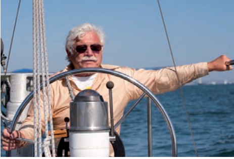
Rysunek 2.5. Balans bieli Daylight, ustawienia: 1/5000 s, f/6,3, ISO 640