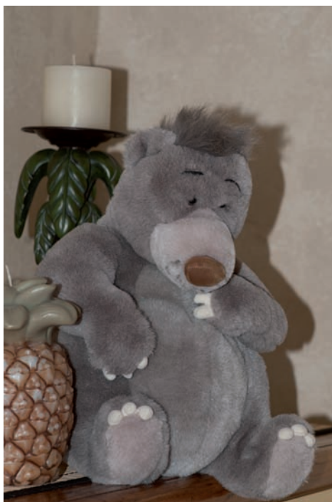
Rysunek 2.15. To zdjęcie zrobiono z fleszem wycelowanym bezpośrednio w misia. Kierunek światła jest widoczny dzięki ostremu cieniowi na ścianie za pluszakiem. Ustawienia: 1/30 s, f/6,3, ISO 100

Gdynosisz ze sobą lampę błyskową, zawsze masz dostęp do źródła światła. Może to być mała wbudowana lampa na szczycie aparatu lub samodzielny element, który może konkurować nawet ze światłem słonecznym, jeśli jest właściwie używany. Poza kilkoma najnowocześniejszymi profesjonalnymi aparatami, cyfrowe lustrzanki wyposażone są we wbudowaną lampę błyskową, zamontowaną nad wizjerem. Uważam tę lampę za przydatną jedynie w nagłych wypadkach, a zazwyczaj stosuję ją wyłącznie po to, aby uruchomić lampę zewnętrzną. Problem polega na tym, że światło z lampy błyskowej w aparacie nie wygląda naturalnie. Łatwo rozpoznasz fotografię powstałą przy takim oświetleniu, bo zazwyczaj sprawia negatywne wrażenie, przyciągając Twoją uwagę do oświetlenia, a nie fotografowanego obiektu. W bardzo nielicznych sytuacjach zechcesz oświetlić swój obiekt rażącym światłem, na przykład robiąc zdjęcie portretowe do paszportu.