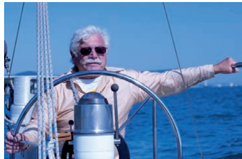
Rysunek 2.10. Balans bieli Fluorescent, ustawienia: 1/5000 s, f/6,3, ISO 640