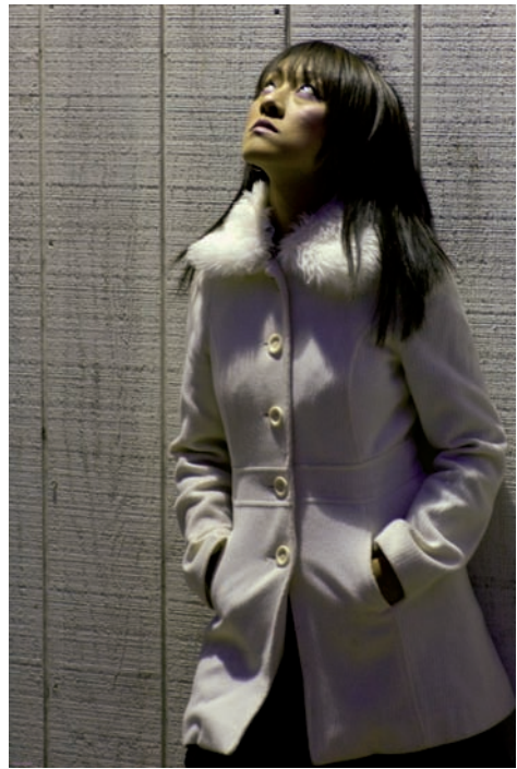
Rysunek 2.14. Ten portret powstał nocą na świeżym powietrzu pod dużym fluorescencyjnym oświetleniem. Jak widzisz, na zdjęciu po lewej zielony odcień wygląda bardzo nienaturalnie. Po prawej balans bieli został dostosowany, aby zrównoważyć dominantę. Oba zdjęcia powstały przy ustawieniach 1/20 s, f/2,1, ISO 640