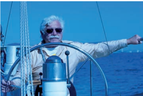
Rysunek 2.9. Balans bieli Tungsten/Incandescent, ustawienia: 1/5000 s, f/6,3, ISO 640