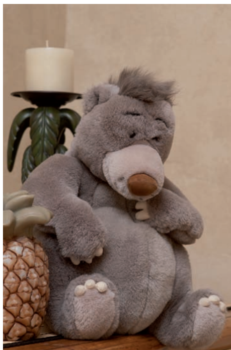
Rysunek 2.16. Ta fotografia, z misiem widocznym na zdjęciu 2.15, powstała po wycelowaniu flesza w sufit. Nie tylko zniknął ostry cień, ale zmieniły się także kolory, dzięki temu, że światło odbiło się od sufitu i ścian. Ustawienia: 1/30 s, f/6,3, ISO 100